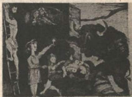
Variation on Picasso's Minotauromaquia 1984