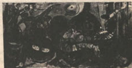
Vejigante Dormida, 1985

Amigos de Elizam Escobar c/o Editorial El Coquí 1671 North Claremont Chicago, IL 60647 (312) 342-8023