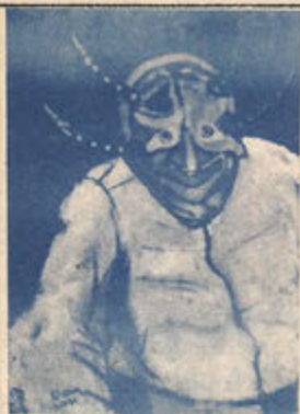
El Vejigante, 1984