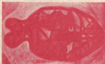
Fish No. 1 Visionary Image, 1984