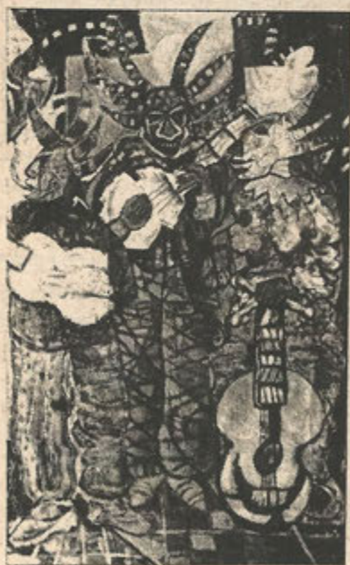
The Gravediggers, 1985

The National Committee to Free Puerto Rican Prisoners of War understands that these two positions are complementary and that we all have the obligation to support our political prisoners and prisoners of war. That is how we see it. ☆