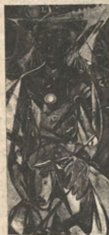
The Guard and his Pack of Dogs 1984

A national exhibition of Puerto Rican Prisoner of War Elizam Escobar's art work, which includes drawings, sketches and paintings, premiered in Chicago on November 15, 1986 at the Axe Street Arena. The exhibition was very successful and drew a large opening night crowd.