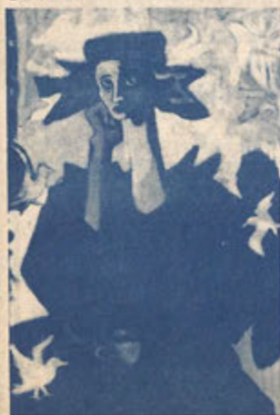
La Poeta, 1985

Para obtener mayor información sobre la exhibición o el catálogo comuníquese con: