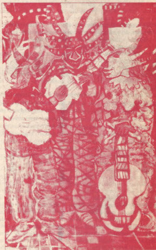
Los Sepultureros, 1985

El Arte como Acto de Liberación, un impresionante catálogo que contiene muchas reproducciones en cuatro colores del trabajo de arte de Elizam y varios artículos escritos por artistas prominentes, incluyendo al artista mismo, fue también publicado para conmemorar la exhibición.