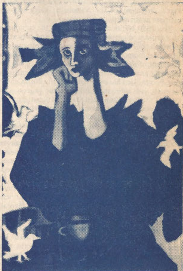
The She-Poet, 1985

The Friends of Elizam Escobar c/o Editorial El Coquí 1671 North Claremont Avenue Chicago, IL 60647 312) 342-8023