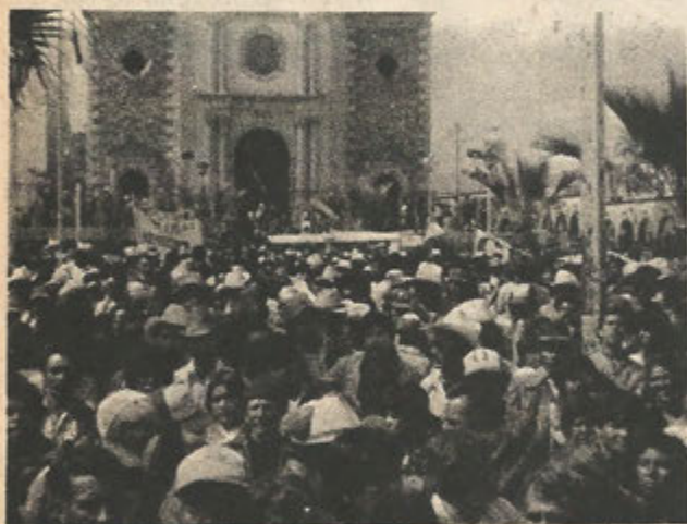
Liberación Nacional Puertorriqueño at the rally and cultural-literary event held later that day.